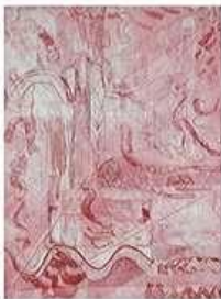
PACITA ABAD (Filipina-American, 1946 – 2004) Egyptian Mosque 08 (Purple) [Mezquita egipcia 08 (púrpura)] 1981 Aguafuerte sobre papel 12 × 9" (30.5 × 22.9 cm) Patrimonio artístico de Pacita Abad