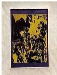
PACITA ABAD (Filipina-American, 1946 – 2004) Women in Bangladesh [Mujeres en Bangladesh] 1981 Serigrafía sobre papel 9 × 7" (22.9 × 17.8 cm) Patrimonio artístico de Pacita Abad