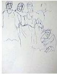
PACITA ABAD (Filipina-American, 1946 – 2004) Dance Crowd [Multitud bailando] 1979 Tinta sobre papel 12 × 9" (30.5 × 22.9 cm) Patrimonio artístico de Pacita Abad