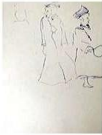
PACITA ABAD (Filipina-American, 1946 – 2004) Dervish Dancer [Bailarín derviche] 1979 Tinta sobre papel 12 × 9" (30.5 × 22.9 cm) Patrimonio artístico de Pacita Abad